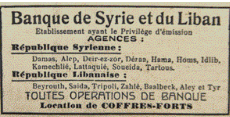
La période chéhabiste des réformes a vu, en 1963, l'adoption du code de la monnaie et du crédit qui instaure une banque centrale et réglemente l'activité des banques commerciales. Cette étape décisive a suivi une série de dispositions partielles de régulation et a coïncidé avec la fin du privilège d'émission de la Banque de Syrie et du Liban.

banques", d'installer leurs propres réseaux de communications, d'organiser leurs systèmes de convoyage de fonds sur le territoire libanais et vers l'étranger. Le morcellement du territoire les a, de plus, conduites à multiplier leurs agences, les amenant progressivement à s'intéresser au métier de la banque de détail. Cette "protection" des banques n'était pas seulement due aux arrangements qu'elles ont dû consentir avec les milices de tous bords, elle tenait en grande partie au fait que les forces en place, que le prolongement de la guerre avait poussé à s'institutionnaliser sous la forme de pouvoirs de fait territorialisés, avaient reconnu l'intérêt de préserver le système bancaire qui assurait leurs propres affaires, y compris leurs financements et leurs transactions extérieures, mais surtout qui permettait à la population de survivre en maintenant le fonctionnement du minimum de relations économiques domestiques et en acheminant vers les familles les transferts croissants en provenance de l'étranger, la guerre ayant coïncidé avec le boom pétrolier et ayant suscité une émigration considérable. À l'exception des banques américaines, les banques étrangères ont continué d'opérer pendant tout le conflit, bénéficiant d'un label de sécurité. →