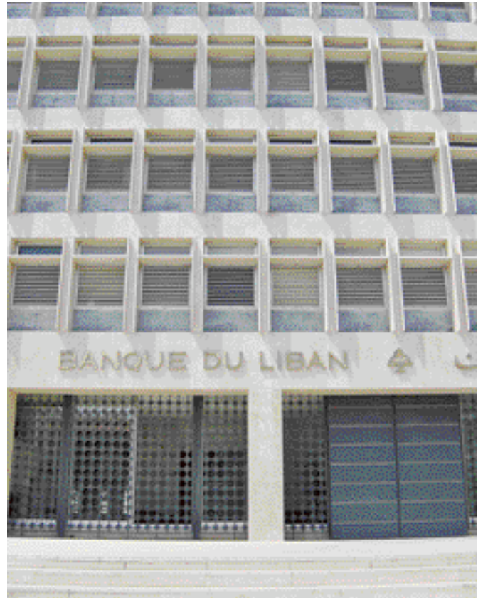
Paradoxalement, la guerre n'a amené aucune banque libanaise à faire défaut envers ses clients. Il y a eu des cas de "banques en difficulté", le plus souvent en raison d'une gestion hasardeuse ou malhonnête, mais l'absence de crise systémique a permis à la Banque centrale de les renflouer en organisant leur reprise par d'autres banques ou en les reprenant elle-même.

Cette puissante mécanique a commencé à se gripper sérieusement en 2000. Des décisions majeures ont été prises à l'au-